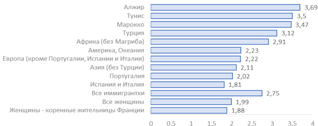
Рисунок 2. Коэффициент суммарной рождаемости иммигранток в зависимости от страны их рождения, детей на 1 женщину, 2014

Уровень рождаемости у иммигранток варьируется в зависимости от страны рождения. С коэффициентом суммарной рождаемости, равным 3,5 ребенка на женщину, иммигрантки из Магриба (Алжира, Марокко, Туниса) характеризуются самым высоким значением показателя (рисунок 2).