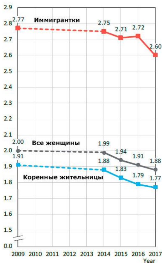
Рисунок 1. Коэффициент суммарной рождаемости (итоговая рождаемость условных поколений) иммигранток и коренных жительниц во Франции, детей на 1 женщину

Какова ситуация во Франции? Данные переписи показывают, что в 2017 г. у коренных жительниц и иммигранток было зафиксировано 1,8 и 2,6 ребенка в расчете на одну женщину соответственно, т. е. разница составляла 0,8 ребенка. Для всего населения Франции в целом коэффициент суммарной рождаемости был близок к 1,9.